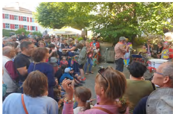
Comité des Fêtes Pot d'Accueil tous les samedis de l'été