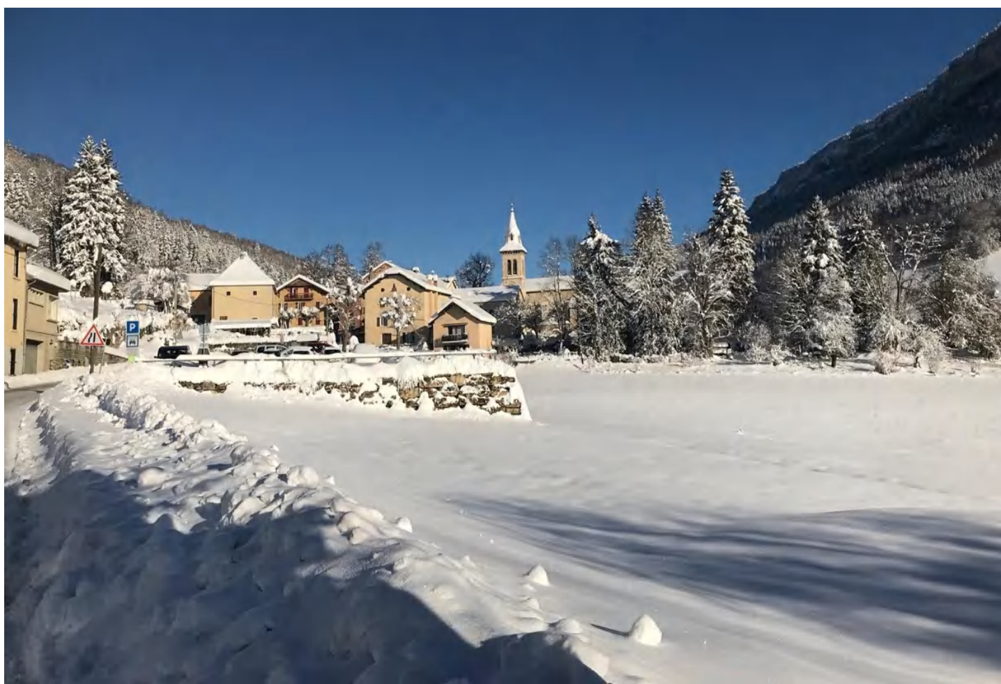
Saint-Martin-en-Vercors sous la neige

Souhaitons un Joyeux Anniversaire à L'Écho de Roche Rousse qui fête son 50 ème numéro. Le premier bulletin municipal est paru en novembre 1998.