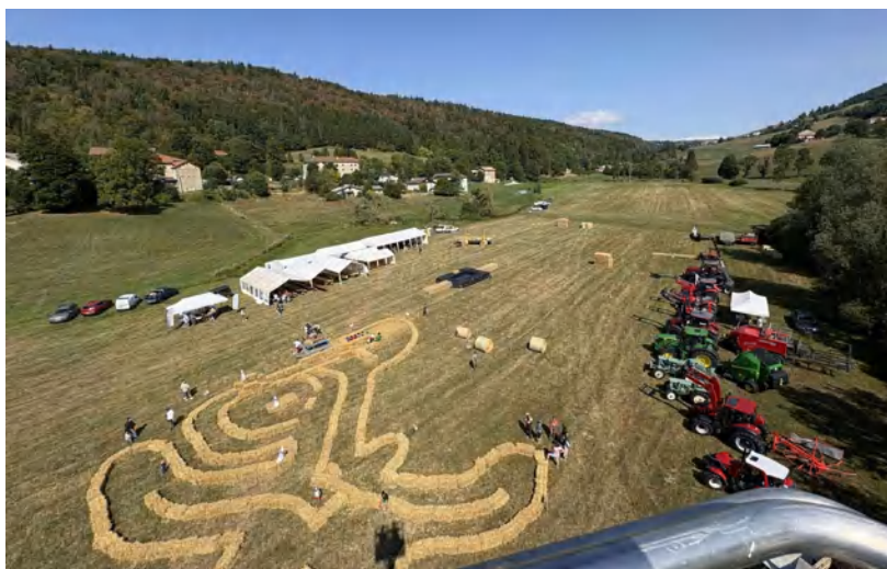
Fête agricole le samedi 23 août 2025