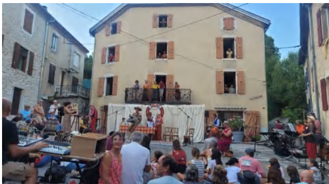
Août 2025, le « Bazar fait rencontre » à Saint-Martin