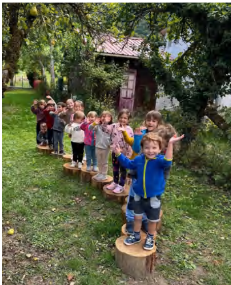
Découverte des nouveaux pas japonais à l'école maternelle