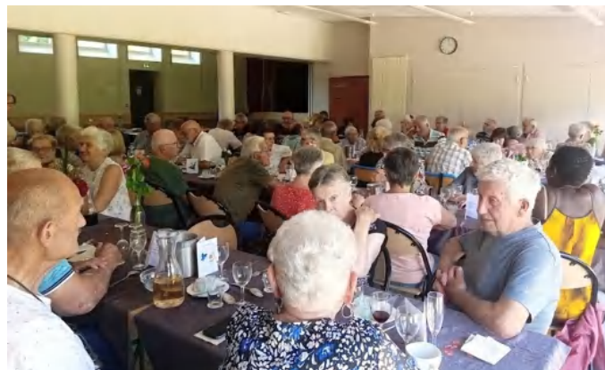
Repas des Anciens le 18 juin 2025