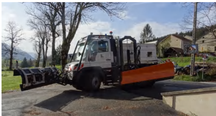
Nouvel engin de déneigement