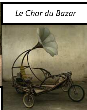
Le Char du Bazar