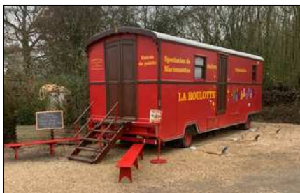
La roulotte qui sera des nôtres pendant le Bazar