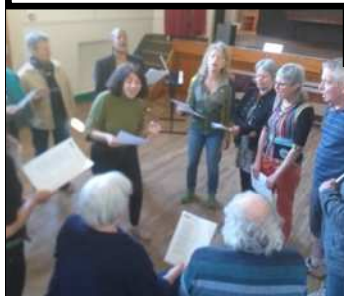
Les répétitions vont bon train !