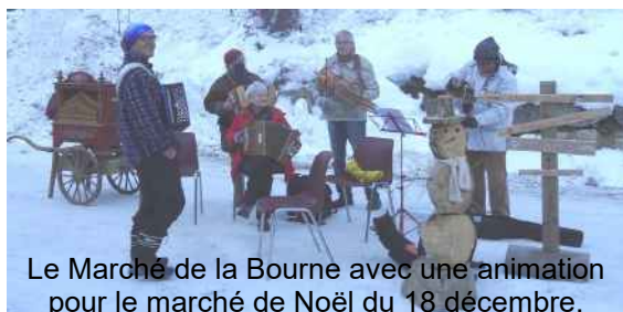
Le Marché de la Bourne avec une animation pour le marché de Noël du 18 décembre.

Le Marché de la Bourne c'est : tous les samedis matin de 9 h à 12 h 30 à la Balme de Rencurel, dans le parc Jean Serratrice, au bord de la Bourne.