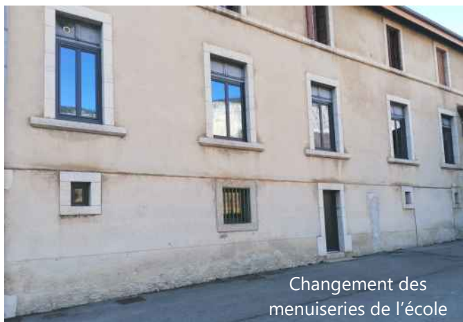
Changement des menuiseries de l'école

Le coût de ce projet s'élève à 106 498 € TTC, subventionné à 80 % par l'Etat, la Région Auvergne-Rhône-Alpes et le Syndicat des Energies de la Drôme dans le cadre des plans France Relance et Bonus Relance Région.