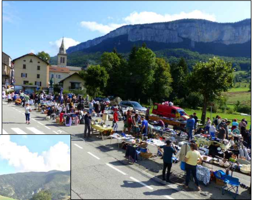
au village... p. 3 à 7