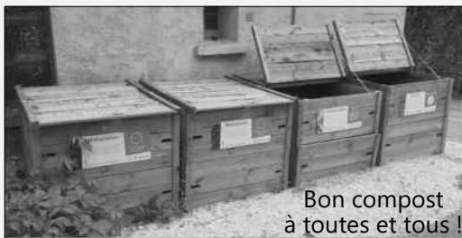
Bon compost à toutes et tous !

Appel aux bonnes volontés : Si quelqu'un broie des branches et ne sait que faire des copeaux, ils seront les bienvenus dans le bac du broyat.