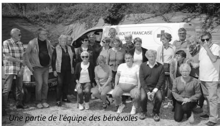
Une partie de l'équipe des bénévoles

Basée à Saint-Jean-en-Royans, la Croix-Rouge du Vercors Royans est composée d'une cinquantaine de bénévoles.