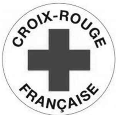
Unité locale du Royans-Vercors