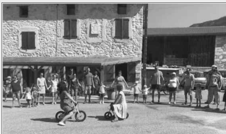
Bal pour enfants à Tourtre : « Le bal à vélo »