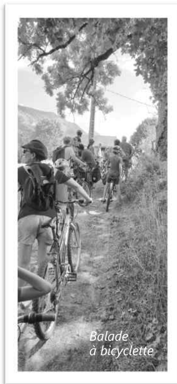
Balade à bicyclette