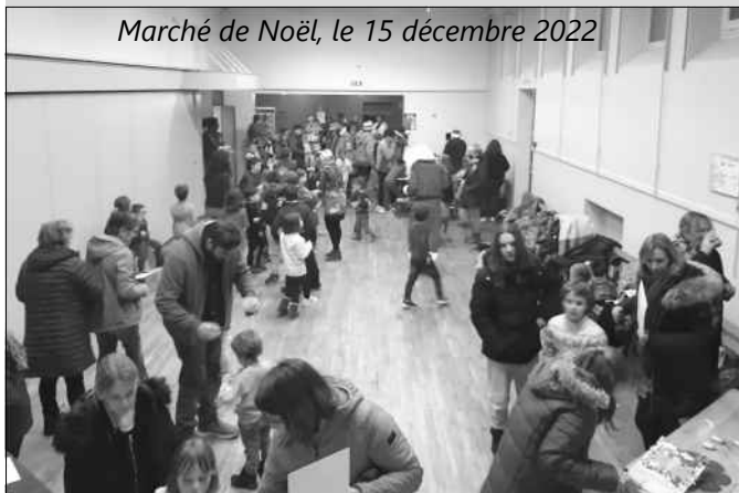
Marché de Noël, le 15 décembre 2022