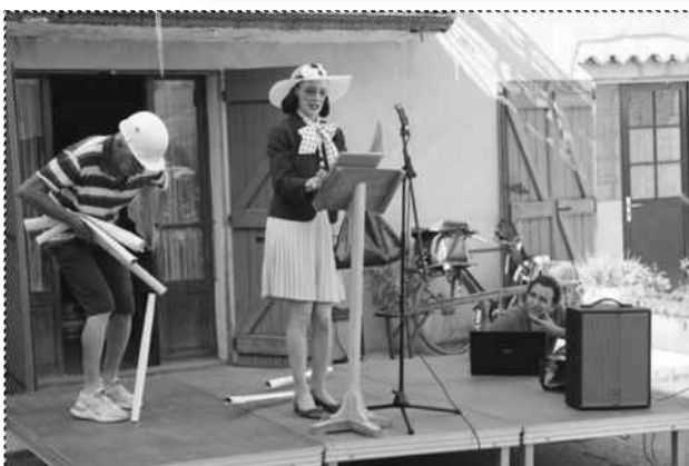
Déambulation théâtrale et musicale « Campagnes Sublimes »