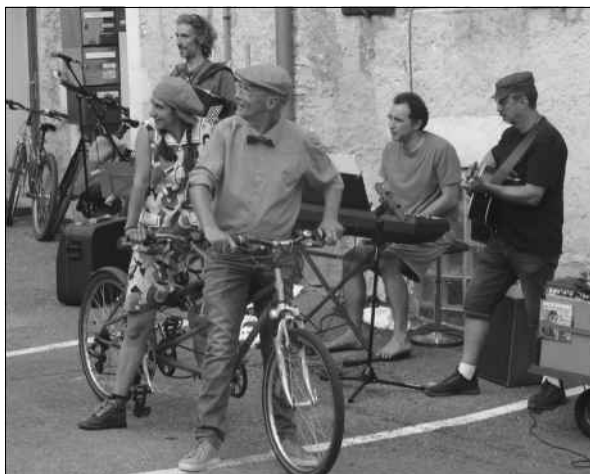
Concert en plein air « Chantons la bicyclette aux fenêtres »

Les animations proposées tout au long de la semaine furent nombreuses et variées : balades à bicyclette, concerts en plein air « Chantons la bicyclette aux fenêtres », spectacles de rue, déambulations théâtrale et musicale, conférence, bal pour enfants, atelier réparation de bicyclette, expositions, projection en plein air, bal folk... Un résumé en images ci-dessous.