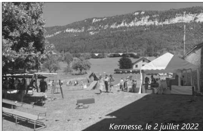
Kermesse, le 2 juillet 2022