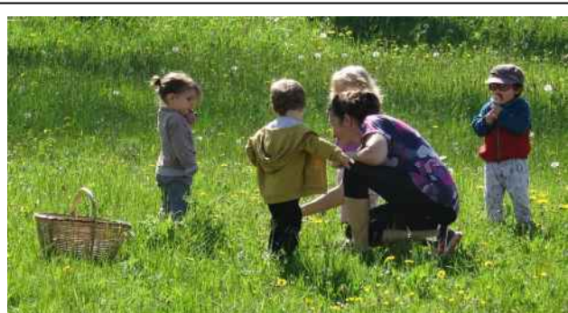
Cueillette de fleurs de pissenlit dans la prairie en face de la crèche

Depuis début 2022, " Berlingot " lieu d'accueil enfants-parents (LAEP) est également présent tous les mardis des semaines impaires de 8 h30 à 11 h.